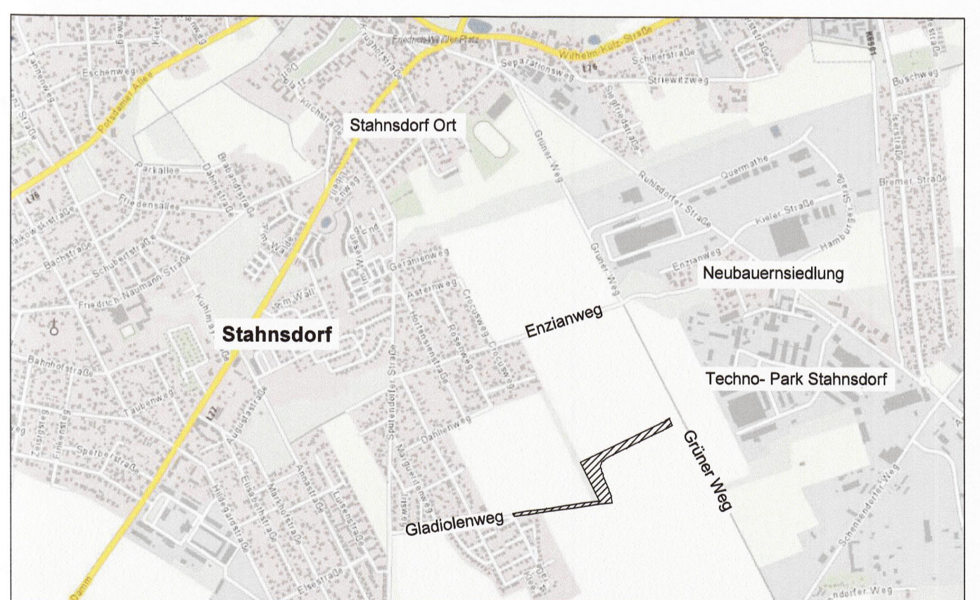
Übersichtskarte (ohne Maßstab)

Gemeinde Stahnsdorf Bebauungsplan Nr. 14 "Verlängerung des Gladiolenwegs bis zur L 77n" Satzung Stand: Oktober 2018 Maßstab: 1:1.000